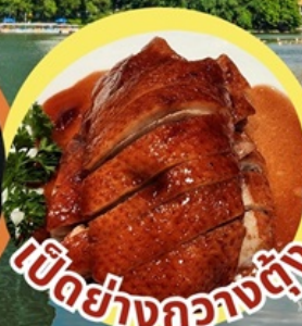
เป็ดย่างกวางตุ้ง