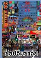
ช้อปปิ้งจางจ๋วย