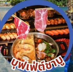
บุฟเฟ่ต์ชาบู