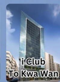
i Club To Kwa Wan

คอนเฟิร์มเดินทาง พฤศจิกายน 2567 2-4 / 9-11 / 16-18 23-25 / 30 พ.ย. - 2 ธ.ค.