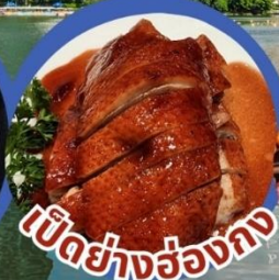
เป็ดย่างฮ่องกง