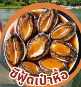
ซีฟู้ดเป่าหื้อ