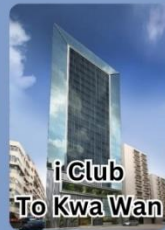
i Club To Kwa Wan