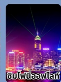
ชมไฟนีออนไฟท์

ราคาเที่ยวเที่ยวเกินคุ้ม 12,999 บาท/ท่าน