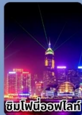
ชมไฟนีออนไฟรี่