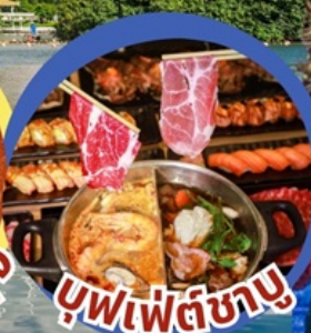
บุฟเฟต์ซาบู