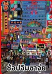
ช้อปปิ้งจตุรัส