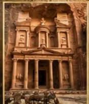
นครเพตรา