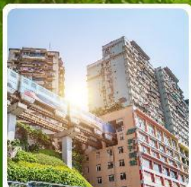
รถไฟทะเลตึก