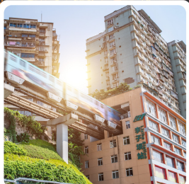
รถไฟฟ้าตึก

ไฮไลท์! เช็กอินตึกตะเกียบ แลนด์มาร์คดังของจงชิ่ง ชมรถไฟฟ้าทะลุตึก อลังการแสงสีที่หงหยาดตง