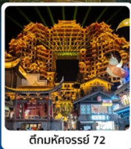
ตึกหัตถจารย์ 72