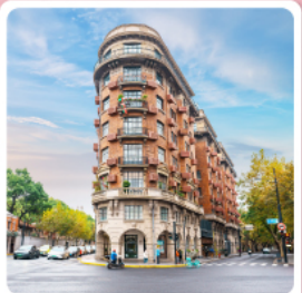
ถนนอู๋คัง

ไฮไลต์...เที่ยวเซียงไฮ้ หางโจว ซุปปิงถนนหนานกิง ชมความสวยงามของหาดไว่กาน ทะเลสาบซีหู