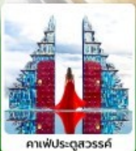
คาเฟ่ประตูสวรรค์

• ไฮไลท์ พิธีทอดเขาฟ่านฮิน ชมวิวเมืองซาปาแบบ 360 องศา สัมผัสกลิ่นอายยุโรปที่ปราสาทตามด้าว เขาคินคาฟู่สูงแก่ประตูสวรรค์