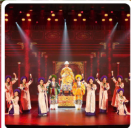
The Heritage Show