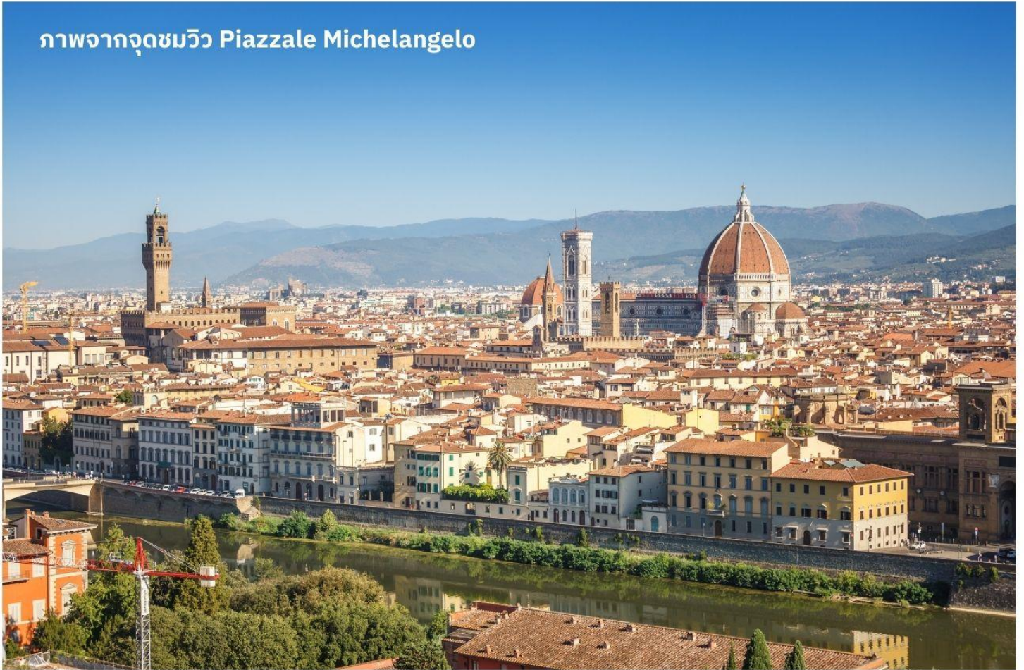
ภาพจากจุดชมวิวก Piazzale Michelangelo

เมืองฟลอเรนซ์ ตั้งอยู่ทางตอนเหนือของประเทศอิตาลี เป็นเมืองที่มีชื่อเสียงในช่วงศตวรรษที่ 13-14 ซึ่งเป็นยุคที่เจริญรุ่งเรืองของวัฒนธรรมและศิลปะ อีกทั้งในอดีตยังมีความสำคัญทางการค้าและวัฒนธรรม มีสถาปัตยกรรมที่งดงามและเป็นที่มาของศิลปะโรแมนติกที่เจริญรุ่งเรืองอย่างมากในยุคนั้น นำท่านเดินทางไปยังเนินเขา Piazzale Michelangelo เพื่อชมวิวของเมือง Florence ที่นักท่องเที่ยวรวมไปถึงชาว Florence เอง มักขึ้นมาชมบรรยากาศในมุมสูงของเมือง ซึ่งจะเห็นหลังคาสีแดงของอาคารบ้านเรือนต่างๆ รวมไปถึง Duomo เรียงรายกันเป็นแนวสวยงามยิ่งนัก อีสาระให้ท่านเก็บภาพประทับใจตามอัธยาศัย