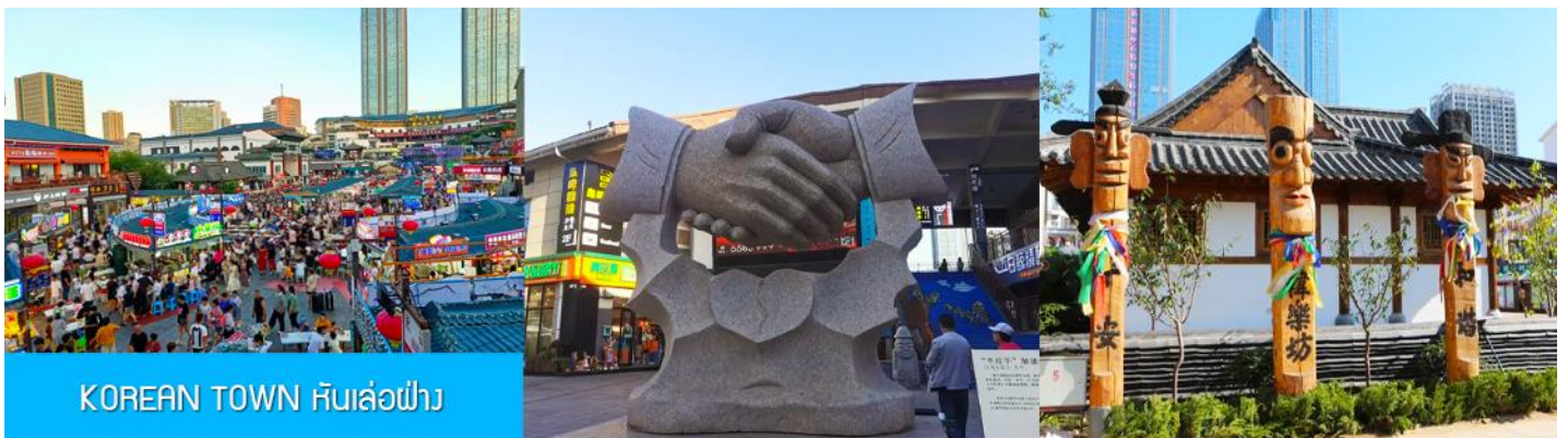
KOREAN TOWN หันล่อฟ้า