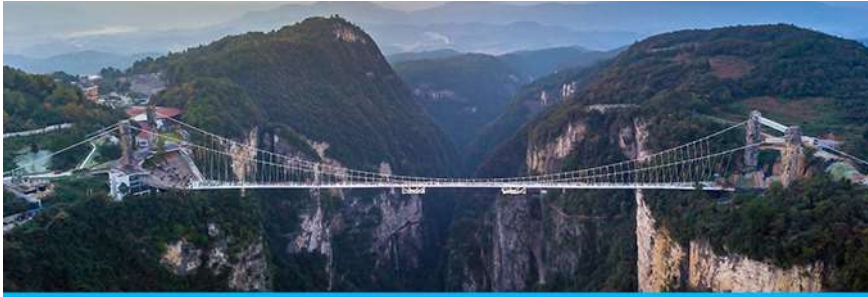
สะพานกระจกจางเจียเจีย

อัตราค่าบริการสำหรับโปรแกรมเสริมการแสดงชุด The love Story of Wooden man and Fairy Fox ท่านละ 400 หยวน (หรือ 2,000 บาทขึ้นอยู่กับอัตราแลกเปลี่ยน) ระยะเวลาที่ใช้ในการเที่ยวชมการแสดง ประมาณ 3 ชั่วโมง รวมเวลาเดินทางไป กลับค่าบริการรวม ค่าบัตรเข้าชม ค่ารถรับ ส่ง และค่าน้ำดื่มของไกด์ท้องถิ่น พักที่ GUIYUANZHENPIN HOTEL โรงแรมระดับ 4 ดาวหรือเทียบเท่า