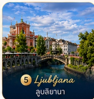
5 Ljubljana ลูบลิยานา