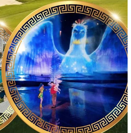
การแสดงม่านน้ำ