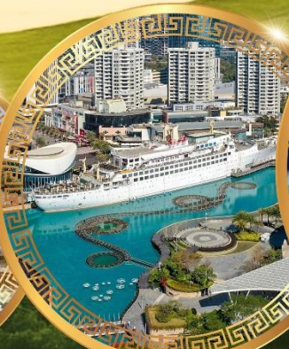
ท่าเรือ Sea World