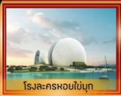
โรงละครหอยไข่มุก