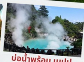
บ่อน้ำพุร้อน เปรปุ

หมู่บ้านยูฟูอินฟลอร์ริล ทะเลสาบคินริน ทะเลสาปคินริน บ่อน้ำพุร้อน อุมิจิโกกุ ท่าเรือโมจิโกะ เรโร ตลาดปลาคาราโตะ ศาลเจ้ามียาจิดาเกะ ดิวัตตีฟรี ฟุกุโอกะ เบย์ พลาซ่า ช้อปปิ้งออน มอลล์ หิ้งคูเมโอโตะอิวะ ชมดอกไม้ไฮเดรนเยีย รอนน้ำตกชิราอิโตะ ช้อปปิ้งย่านเท็นจิน