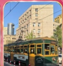
ขั้วรถรางไฟฟ้าชมเมือง