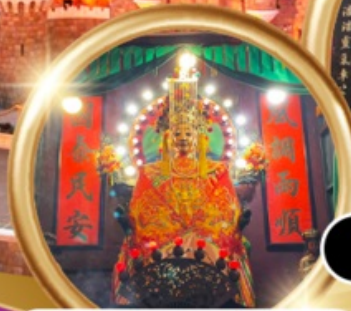
ขอพรซื้อขายอสังหาริมทรัพย์