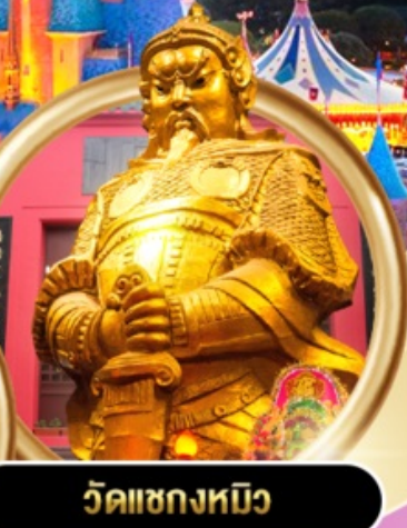
วัดฯชกงหนิว

• ดิสนีย์แลนด์ (เต็มวัน) • วัดฯชกงหนิว • อ่าวรีพัลส์เบย์