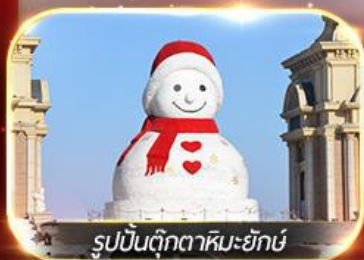
รูปปั้นตุ๊กตาหิมะยักษ์