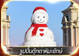
รูปปั้นตุ๊กตาหิมะยักษ์