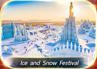
Ice and Snow Festival