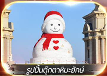
รูปปั้นตุ๊กตาหิมะยักษ์