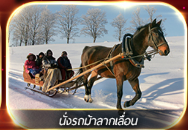
นั่งรถม้าลากเลื่อน

ฟรีนั่งรถม้าลากเลื่อน ชมโชว์ว่ายน้ำน้ำแข็ง แม่น้ำชงหวาเจียง