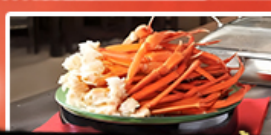
บุฟเฟ่ต์อาหารเย็น + ชาปู 1 มื้อ

บินตรง นาริตะ เครื่องบินลำใหญ่ 370 ที่นั่ง