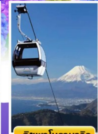
อิซุฟานิรามาวิว

🌫️ ออนเซ็น 1 คั้น 🧳 นน.กระเป๋า 23 กก. ☀️ 7Days 4Night