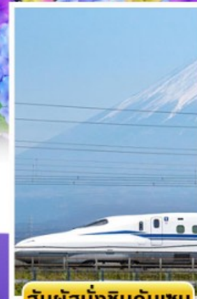
สัมพัสนั่งชินคันเซน