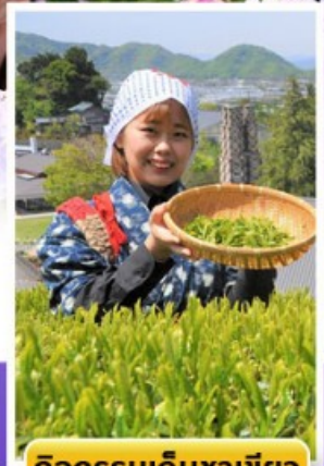
กิจกรรมเก็บชาเขียว