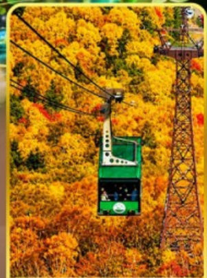
กระเช้าคุโรดากะ