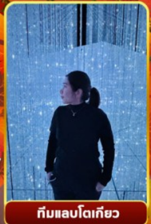
ทีมแอลโตเกียว

🌀 ออนเซ็น 2 คั้น 🧳 นน.กระเป๋า 23 กก.X2 🌞 8Days 5Night