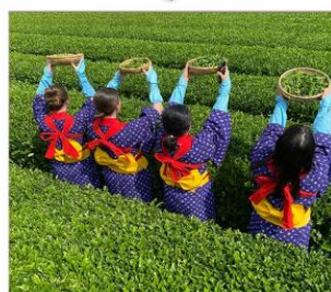
กิจกรรมเก็บชาเมียโนเอ็น