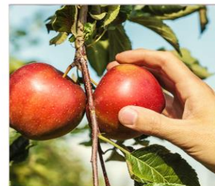
กิจกรรมเก็บแอปเปิ้ล