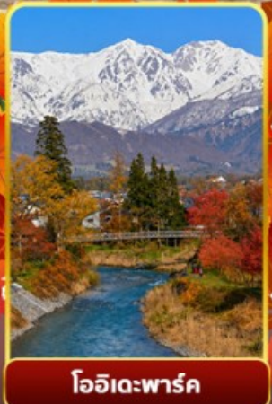
โออิตะพาร์ค