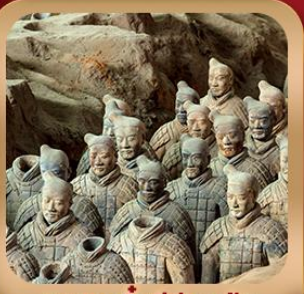
“สุสานจิ้นซีฮ่องเต้”