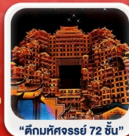
“ตึกมหัศจรรย์ 72 ชั้น”