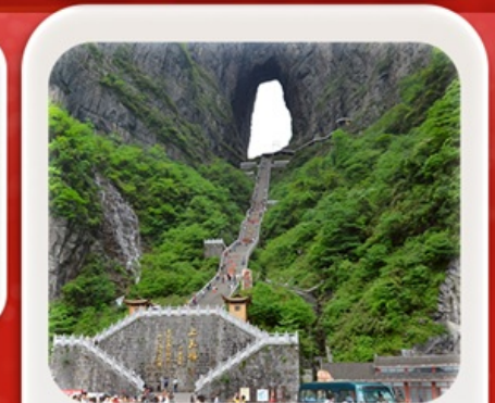
“กำประตูลิ่วหวง”