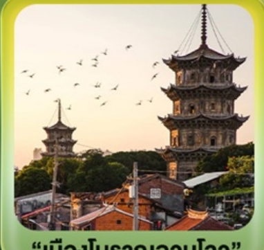
“เมืองโบราณฉวนโจ้ว”