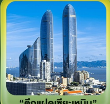
“ตึกแฝดเซี่ยเหมิน”