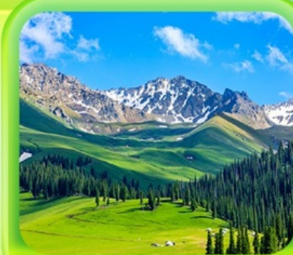
"ทุ่งหญ้านาราตี"