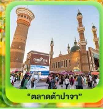
"ตลาดต้าปาจา"

ซินเจียงเหนือ ทะเลสาบไซลี่มู่ "น้ำตาหยดสุดท้ายของแอตแลนติก" • ทุ่งหญ้านาราตี ทุ่งดอกไม้เทียนซาน • ผ่านชมสะพานกั๋วจื่อโกว • ถนนหลิวซิงเจียง • ตลาดต้าปาจา