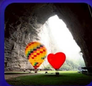
“ ถ้ำเกิ่งหลง ”