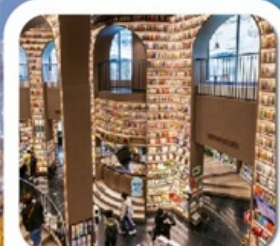
"ห้างสรรพสินค้าจงซูเก๋อ"