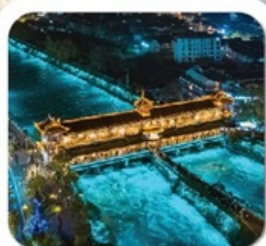
"สะพานหนานเจียว"