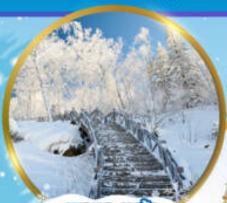
เขาแกะหิมะ