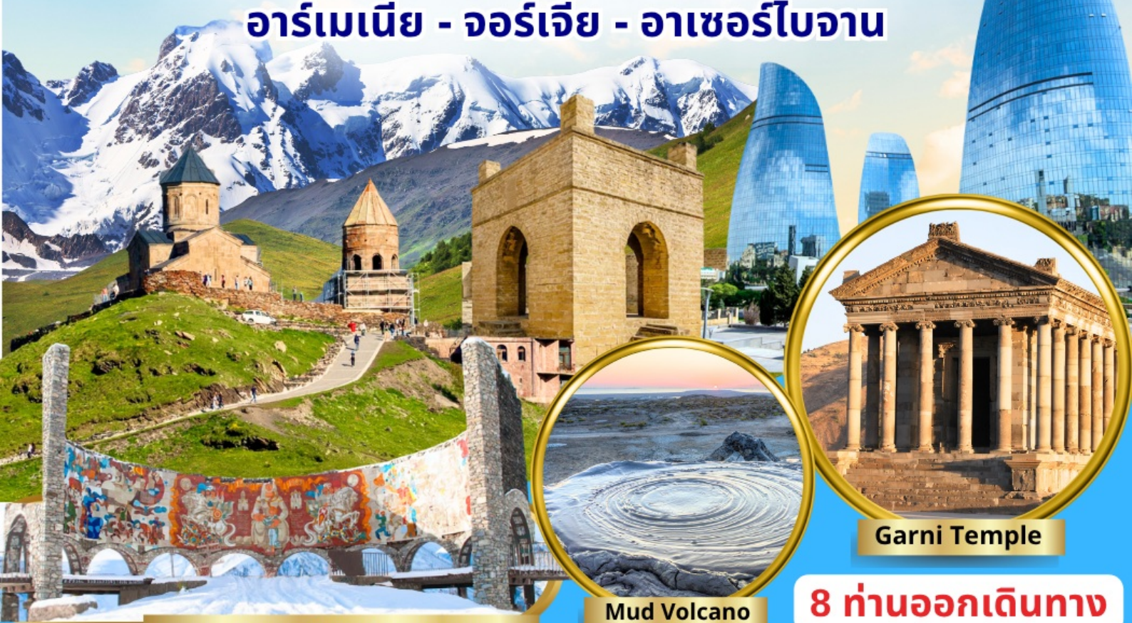
Georgia-Russia Friendship Monument