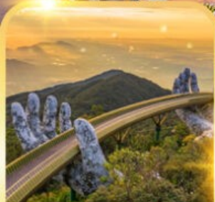
สะพานมือยักษ์

ดานัง ฮอยอัน บานาฮิลล์ เที่ยวบานาฮิลล์เต็มวัน รวมบัตรเครื่องเล่น