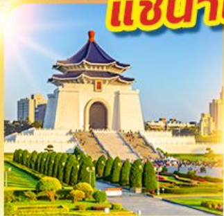
อนุสรณ์เจียงไคเชค