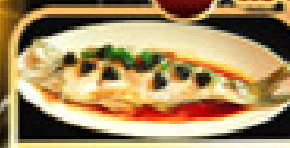
ปลาประธาราหรับดี