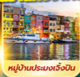
หมู่บ้านประมงเจี๋ยปิ่น