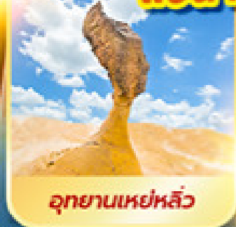
อุทยานเหย่หลิว

เที่ยวเต็ม!! ไม่มีวันอิสระ แช่น้ำแร่ในห้องพักส่วนตัว