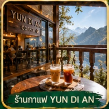
ร้านกาแฟ YUN DI AN