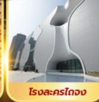
โรงแรมเดอะไทเป