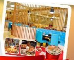
ก๊วยแม่น้ำ + HOTPOT SEAFOOD