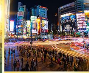
ซีเหมินติง