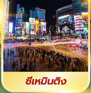
ซีเหมินติง