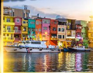
หมู่บ้านประมงเจินปิง