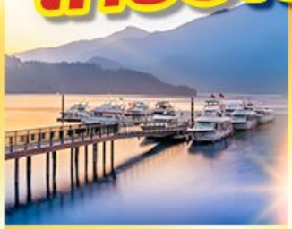
ทะเลสาบสุริยันจันทรา