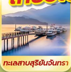
ทะเลสาบสุริยอินจันตรา