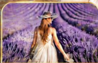
ทุ่งดอกลาเวนเดอร์