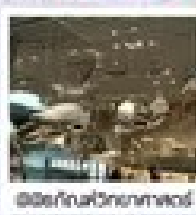
พิพิธภัณฑ์วิทยาศาสตร์