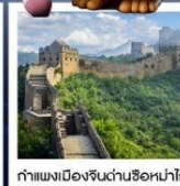
กำแพงเมืองจีนด่านซือหม่าโต