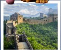
กำแพงเมืองจีนด่านซือหม่าไท่

เมืองโบราณกู่เป่ย์สู่ยจิน / กำแพงเมืองจีนด่านซือหม่าไท่ (รวมค่ากระเช้าขึ้น-ลง) / ชมวิวกำแพงเมืองจีนและเมืองโบราณ ยูนิเวอร์แซลปักกิ่ง (รวมค่าบัตรเข้า) / จัตุรัสเทียนอันเหมิน / พระราชวังโบราณกุ๊กง / หอบูชาเทียนถาน คาเฟ่กาแฟบ้านน้ำตาล (TANG FANG CAFE) / พระราชวังฤดูร้อนอวิ๋เหอหยวน / ย่านชานหลี่ถุน (POP MART) / ถนนคนเดินไท่กู่หลี่