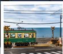
รถไฟเอโนะเด็ง