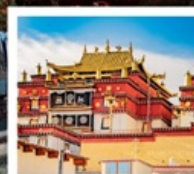
วัดชงจันหลิง