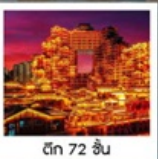
เขากียนเหมินซาน