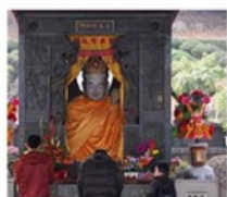
ไถ่ต๋องกง