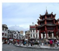
เมืองเก๋าซิวเถา