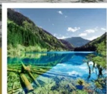
จั๋วจ้ายโกว