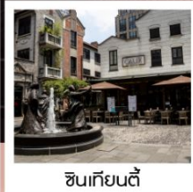
ซินเทียนตี้