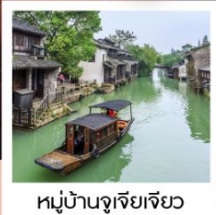
หมู่บ้านจูเจียเจียว

ตะลุยช้อปปิ้ง!! POP MART ราคาเพียง 42,999 FREE VISA