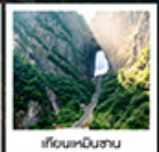
ฝ่งหวงหินงู

กรุ๊ปทัวร์ / สพานกั๋วฝ่งหวง / เขาคิงหนิงซาน / ฟูหลงเจิน / ประตูนงกั๋ว / ไร่ฉางอวตาร / เขาคิงหนิงซาน สวนจอนฝ่งหวง / ภาพวาดทราย / เมืองฟูหลงเจิน / ล่องเรือตามลำน้ำตงเจียง / เขามือโบราณฝ่งหวงยกทำกัน