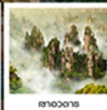
ฉางอวตาร