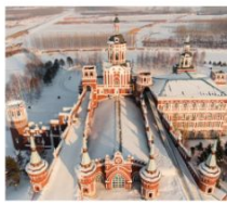
คฤหาสน์วอลการ์