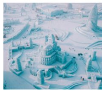
ICE AND SNOW FEST.

คฤหาสน์วอลการ์ (ฟรีเล่น Snow Tubing) โบสถ์เซนต์นิโคลัส / มู่ตันเจียง / ชมแสงสีกลางคืนถนนเสยุนเจียง เขาแกะหิมะ / เขาป้างดูย / ภาพเขียนสี ICE AND SNOW โบสถ์เซินโซเฟีย / เกาะพระอาทิตย์ / เทศกาลแกะสลักน้ำแข็ง